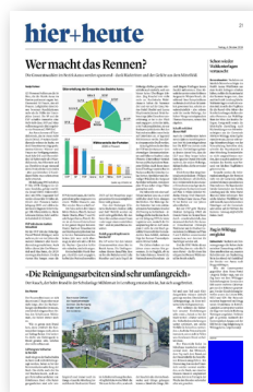
Bundauftakt Fussfeld (45x50mm)