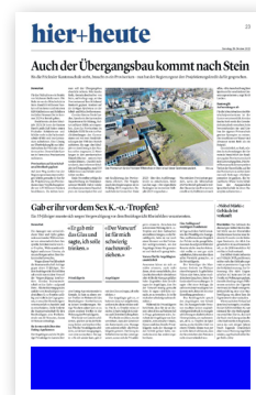
Bundauftakt Fussbalken (291x50mm)