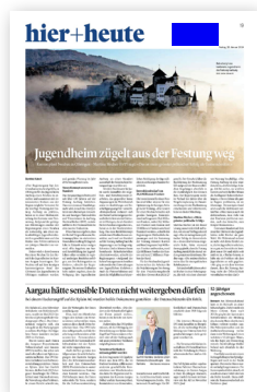
Bundauftakt Kopffeld (60x25mm)