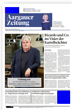
Kopffeld Anriss (60 × 25 mm) Fussfeld (54 × 50 mm)