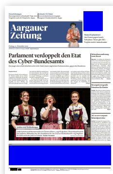
Kopffeld (52 × 52 mm) Fussbalken (291 × 50 mm)