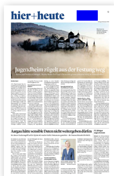
Kopffeld (60 × 25 mm)