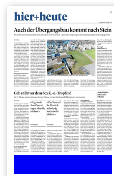
Fussbalken (291 × 50 mm)