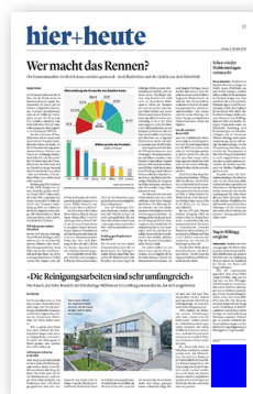
Fussfeld (45 × 50 mm)