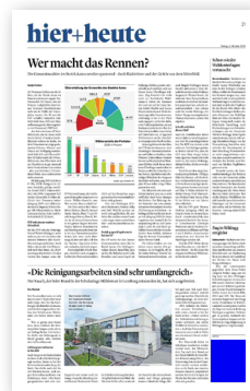
Fussfeld (45 × 50 mm)