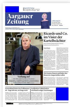
Kopffeld Anriss (60 × 25 mm) Fussfeld (54 × 50 mm)