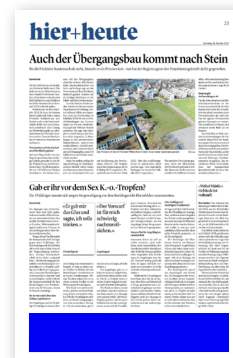
Fussbalken (291 × 50 mm)