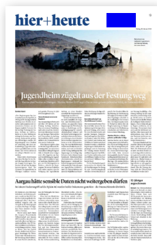
Kopffeld (60 × 25 mm)