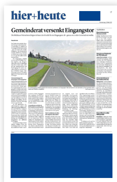
2. Bund Bundauftakt