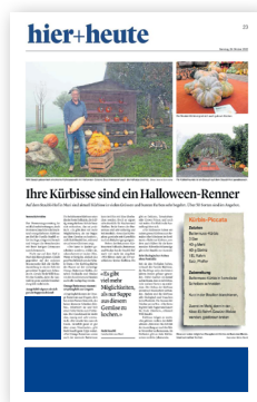
2. Bund Bundauftakt