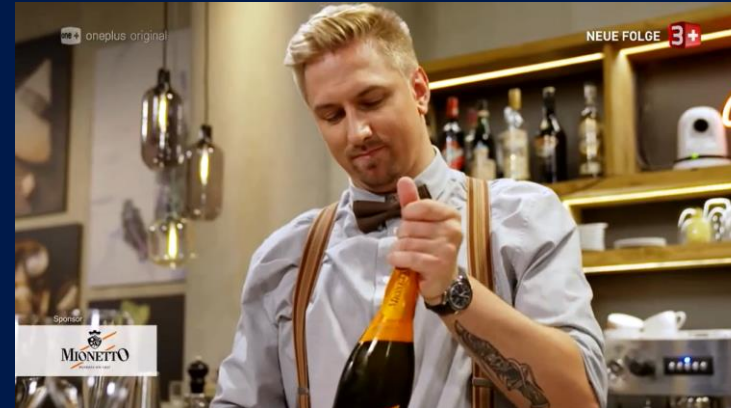
«First Dates», Staffel 03, Sender 3+

Ein Insert-Logo bietet eine direkte Einbettung der Brand in das Programm. Meistens findet es in Kombination mit einem Product-Placement statt, womit die Präsenz verstärkt wird. Darüber hinaus fördert das Insert-Logo die Erkennung und die Erinnerung an die Marke . Der Brand wird ein hohes Mass an Aufmerksamkeit geschenkt.