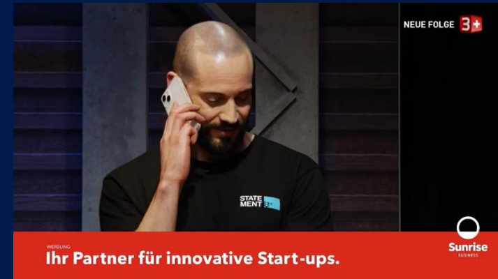
«Die Höhle der Löwen Schweiz», Staffel 05, Sender 3+

Das Cut In verbindet die gezeigte Sendung mit der Werbebotschaft . Es handelt sich um eine sehr effektive Werbeform, da das Element direkt im passenden, redaktionellen Kontext platziert ist. Dadurch wird ein Bezug zwischen der Handlung und dem Produktnutzen hergestellt. Die Werbebotschaft bleibt so besser und länger in Erinnerung .