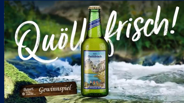
«Bauer, ledig, sucht...», Staffel 19, Sender 3+

Im Gewinnspiel wird die Marke auf ganz besondere Art präsentiert. Die Zuschauenden werden mit einem Gewinnspiel aktiviert , sodass sich das Involvement um einiges steigern lässt. Da sich der Zuschauende mit der Marke beschäftigt, kann eine stärkere Kundenbindung erwartet werden. Zusätzlich steigert sich die Wahrnehmung der Marke, da das Produkt zum Hauptpreis wird.