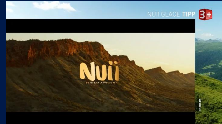
«Sing meinen Song Schweiz», Staffel 05, Sender 3+

Mit einem Station-Tipp präsentiert der Sender ein Produkt oder eine Dienstleistung. Diese Sonderwerbeform ist visuell im Erscheinungsbild des Senders eingebettet . Es entsteht der Eindruck, dass der Sender redaktionell einen Tipp abgibt. Dabei entsteht ein besonders hoher Imagetransfer .