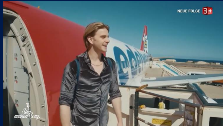
«Sing meinen Song», Staffel 05, Sender 3+

Das Produkt wird in kurzen Sequenzen (z.B. 10 Sek.) auf natürliche Weise in den Handlungsablauf der Sendung integriert. Der redaktionelle Kontext fördert das positive Image der Marke und erhöht die Vertrauenswürdigkeit. Langfristig ist eine Steigerung der Bekanntheit zu erwarten. Das Kreativkonzept wird in enger Absprache mit dem Sponsoren erstellt.