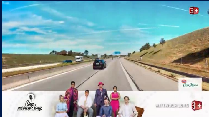
«Sing meinen Song Schweiz», Staffel 05, Sender 3+

Das Promo Cut-In wird während dem laufenden Programm ausgestrahlt und bewirbt das Format. Das Markenlogo ist unmittelbar auf dem Promo Cut-In platziert. Dadurch wird die Wirkung des Sponsorings nochmal gefestigt und ein breiteres Publikum erreicht. Die Platzierung im laufenden Programm generiert eine äusserts hohe Aufmerksamkeit .