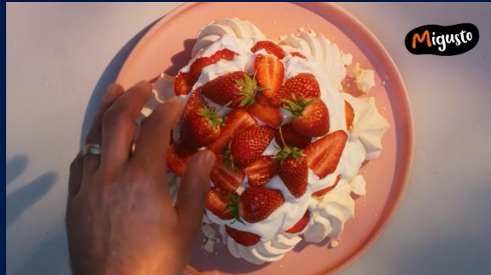
«MasterChef Schweiz», Staffel 02, Sender 3+

Die Billboards präsentieren die Sendung. Der Opener eröffnet am Beginn und der Reminder nach den Werbeblöcken. Das Format schliesst mit dem Closer am Ende. Durch die unmittelbare Nähe zur Sendung bleibt die Marke stark in der Erinnerung der Zuschauenden hängen. Zusätzlich findet durch die Presenter Darstellung ein besonders vorteilhafter Imagetransfer statt.