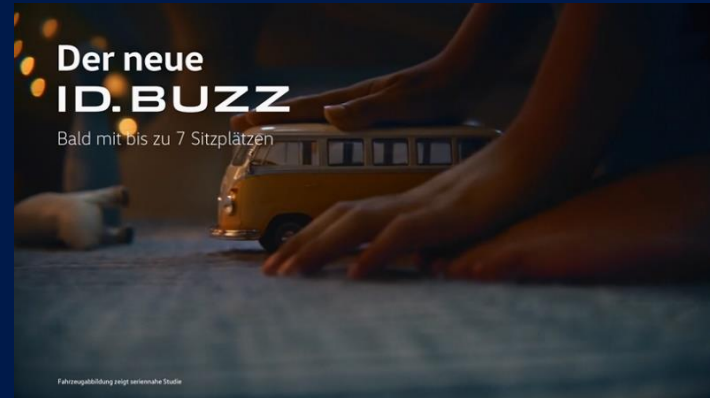
«Sing meinen Song», Staffel 05, Sender 3+

Das Billboard am Trailer ist die perfekte Ergänzung zum Billboard der Sendung. Da die Programmankündigung durch den Trailer schon rund eine Woche vor der Sendung ausgestrahlt wird, festigt sich die Verknüpfung von Marke und der Sendung für die Zuschauenden noch weiter. Ausserdem wird durch die hohe Ausstrahlungsfrequenz auf allen nationalen Sendern eine grosse Reichweite aufgebaut.