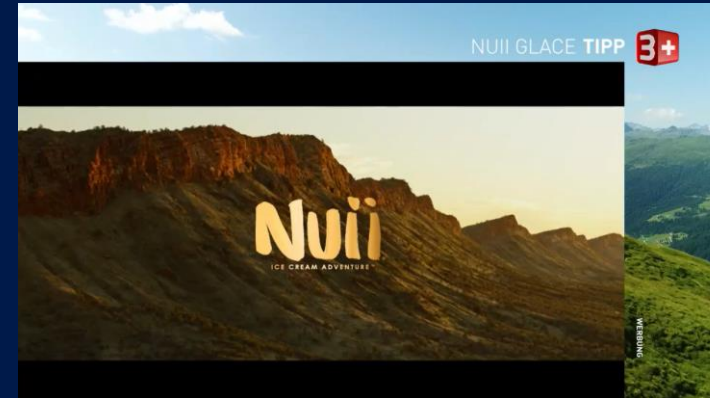
«Sing meinen Song Schweiz», Staffel 05, Sender 3+

Mit einem Station-Tipp präsentiert der Sender ein Produkt oder eine Dienstleistung. Diese Sonderwerbeform ist visuell im Erscheinungsbild des Senders eingebettet . Es entsteht der Eindruck, dass der Sender redaktionell einen Tipp abgibt. Dabei entsteht ein besonders hoher Imagetransfer .