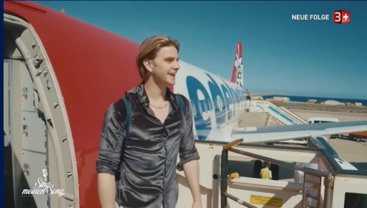
«Sing meinen Song», Staffel 05, Sender 3+

Das Produkt wird in kurzen Sequenzen (z.B. 10 Sek.) auf natürliche Weise in den Handlungsablauf der Sendung integriert. Der redaktionelle Kontext fördert das positive Image der Marke und erhöht die Vertrauenswürdigkeit. Langfristig ist eine Steigerung der Bekanntheit zu erwarten. Das Kreativkonzept wird in enger Absprache mit dem Sponsoren erstellt.