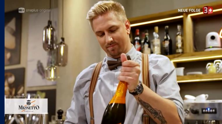
«First Dates», Staffel 03, Sender 3+

Ein Insert-Logo bietet eine direkte Einbettung der Brand in das Programm. Meistens findet es in Kombination mit einem Product-Placement statt, womit die Präsenz verstärkt wird. Darüber hinaus fördert das Insert-Logo die Erkennung und die Erinnerung an die Marke . Der Brand wird ein hohes Mass an Aufmerksamkeit geschenkt.