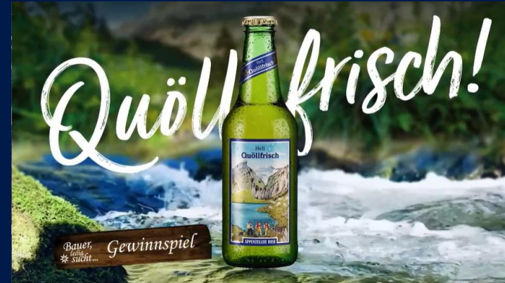
«Bauer, ledig, sucht...», Staffel 19, Sender 3+

Im Gewinnspiel wird die Marke auf ganz besondere Art präsentiert. Die Zuschauenden werden mit einem Gewinnspiel aktiviert , sodass sich das Involvement um einiges steigern lässt. Da sich der Zuschauende mit der Marke beschäftigt, kann eine stärkere Kundenbindung erwartet werden. Zusätzlich steigert sich die Wahrnehmung der Marke, da das Produkt zum Hauptpreis wird.