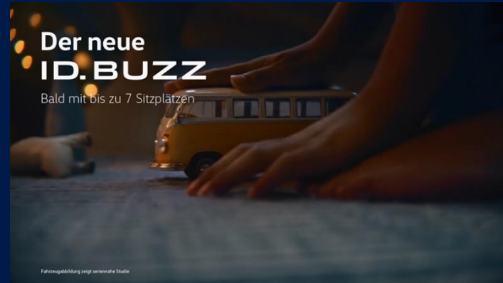
«Sing meinen Song», Staffel 05, Sender 3+

Das Billboard am Trailer ist die perfekte Ergänzung zum Billboard der Sendung. Da die Programmankündigung durch den Trailer schon rund eine Woche vor der Sendung ausgestrahlt wird, festigt sich die Verknüpfung von Marke und der Sendung für die Zuschauenden noch weiter. Ausserdem wird durch die hohe Ausstrahlungsfrequenz auf allen nationalen Sendern eine grosse Reichweite aufgebaut.