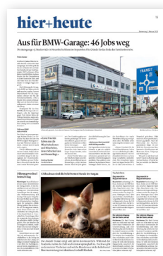
Bundauftakt 2. Bund*