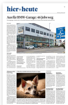
Bundauftakt 2. Bund*