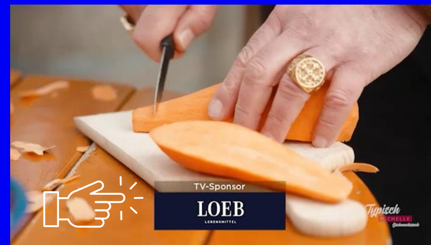
Logo-Insert (Hauptsponsoring oder Produktplatzierungen)